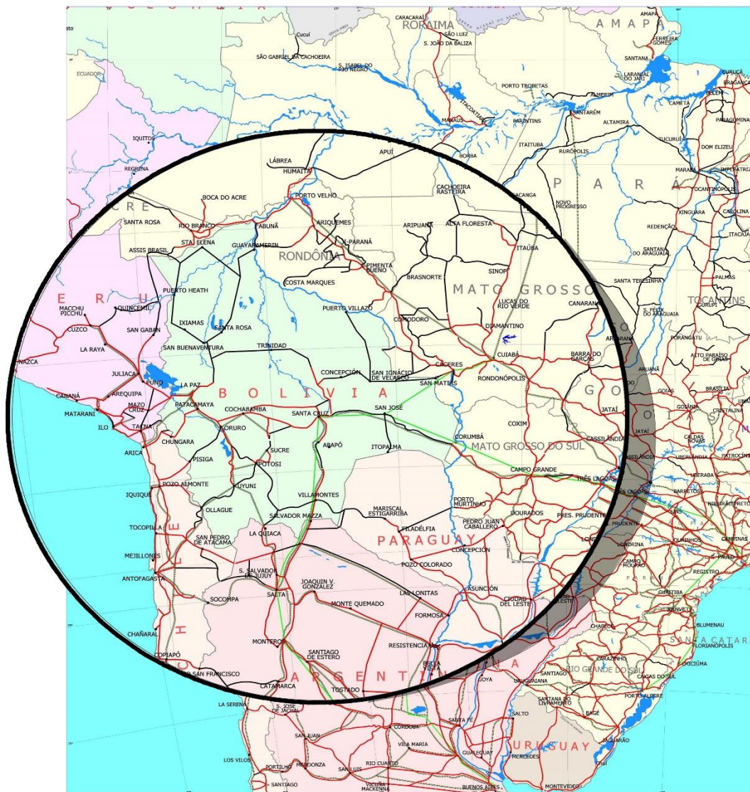
FIG. 1 - MAPA DA INTEGRAÇÃO DO CENTRO-OESTE SUL-AMERICANO

Centro Oeste Sudamericano. Círculo con centro en Santa Cruz de La Sierra, con 1.300 Km. de rayo, con área superior a 5.000.000 km 2 , con cerca de 40 millones de habitantes.